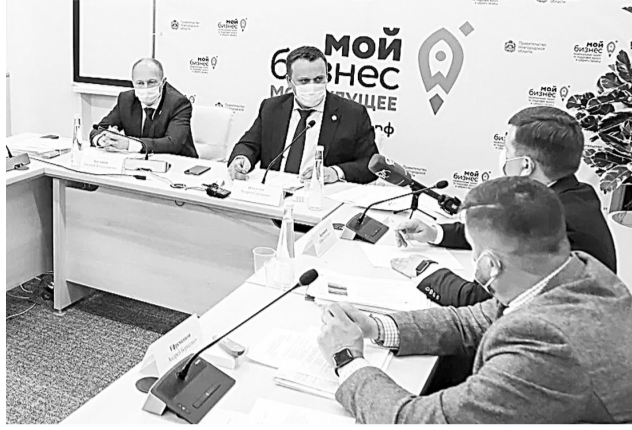
Глава региона в прямом эфире.

Андрей НИКИТИН принял участие в совещании по созданию Инновационного научно-технологического центра.