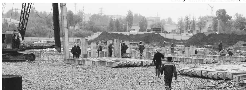
Процесс забивания свай под фундамент новой школы в Боровичах подходит к концу, их будет больше 1000

Сегодня в правительстве России принято решение, и есть соответствующая нормативная база, позволяющая в дальнейшем все новые объекты делать так, что ответственность за весь комплекс работ — от проектирования до сдачи в эксплуатацию — будет нести одна компания».