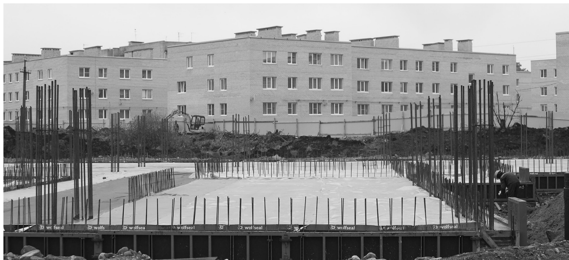
Скоро на этом участке начнётся возведение стен первого этажа